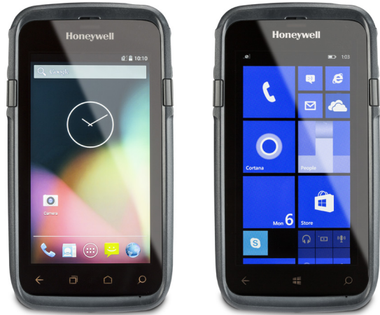
霍尼韦尔最为先进的企业级移动数据终端Dolphin CT50拥有实时连接和业内一流的数据采集能力。

Dolphin CT50是霍尼韦尔最先进的企业级广域网手持数据终端，能够满足企业随时随地实时连接到业务关键型应用以及对数据采集功能的需求，可最大化地提升工作效率并更高效地服务于客户。CT50可支持Windows®或Android™操作系统，以扫描密集型工作流程下具有高度移动性的前线员工为目标用户，如按需送货、现场服务及与客户互动，他们需要真正的移动办公，需要拥有全触屏式智能手机和高度面向未来的现代化设备带来的便利性，以加速业务敏捷度并降低总体拥有成本。